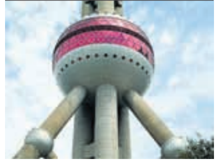
Rundblick auf 263 Meter Höhe.