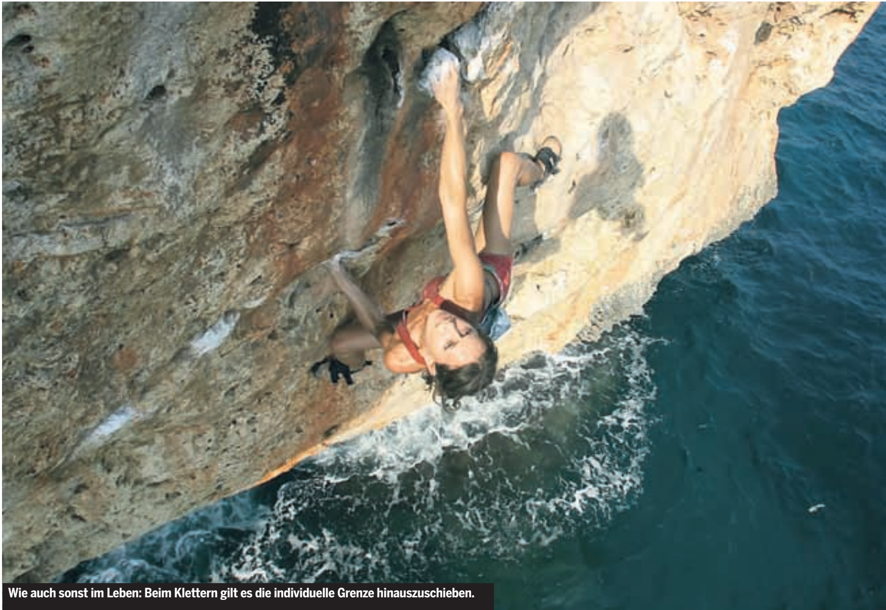
Wie auch sonst im Leben: Beim Klettern gilt es die individuelle Grenze hinauszuschieben.